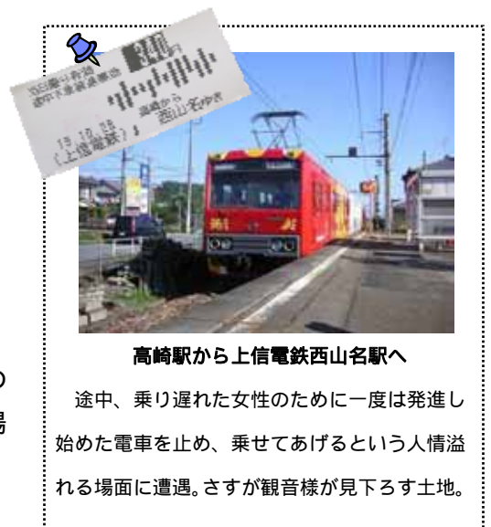
高崎駅から上信電鉄西山名駅へ

駅前で早速ツマグロヒョウモン と遭遇。右羽の一部が欠損している彼女とは、実は下見でも同じ場所では会っているかもしれないのです。もしや運命? と思いつつ、温暖化がちらつきます。