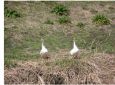
よ〜くかんがえよ〜 おかねはだいじだよ〜♪ AFOAC !