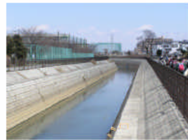
葛西橋の北側は用水路ということ で一変します。ホントに何にもあり ません、いません。