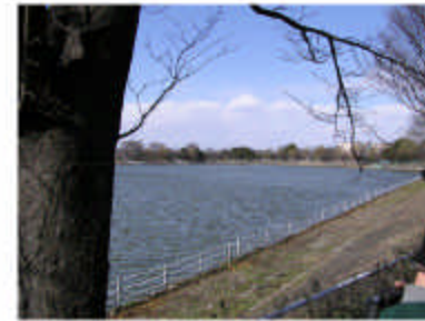
弦代調節池。結構大きな調節池なのですが、 あまり生き物は見られませんでした。