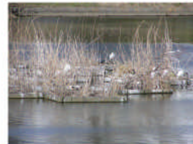
そのお隣の沼井公園池。浮島にサギの姿 をいくつも見る事ができました。 この他、カワセミも見つかってます。