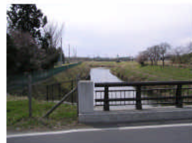
葛西橋の南側はこうなっている のですが…