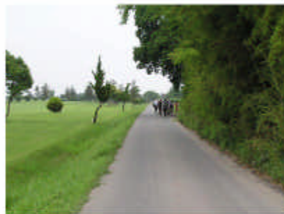
屋敷森と田園地帯が続く握津地区。既に廃屋も多く…