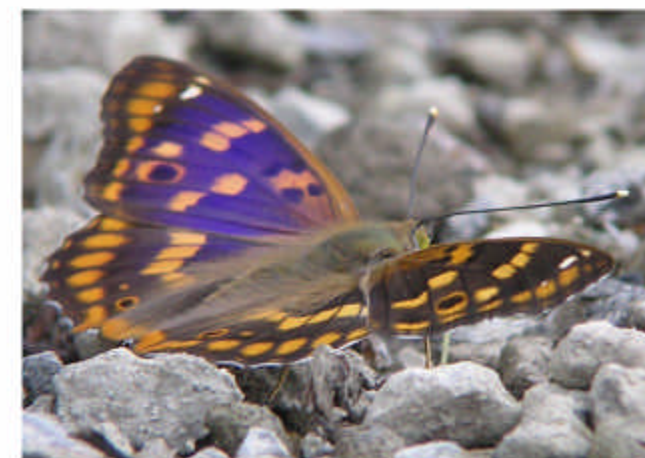
お昼の時飛んでいました。 見ましたか？