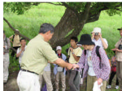
おなじみ昼食後の表彰式。今回は4名 （10回2名、20回2名）。