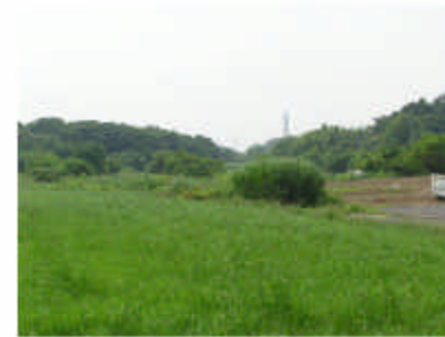
秋葉の森周辺。これからどのように 整備されるのでしょうか…？