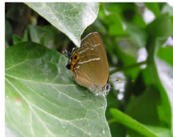
今回はちらっと飛んだのを一部の 人が見ただけ。これは下見の時の ものです。