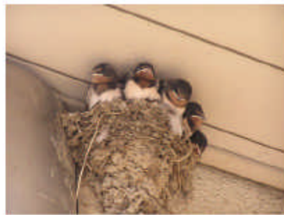
指扇駅前にはツバメの巣が！ もうすぐ空へと飛び立つ時