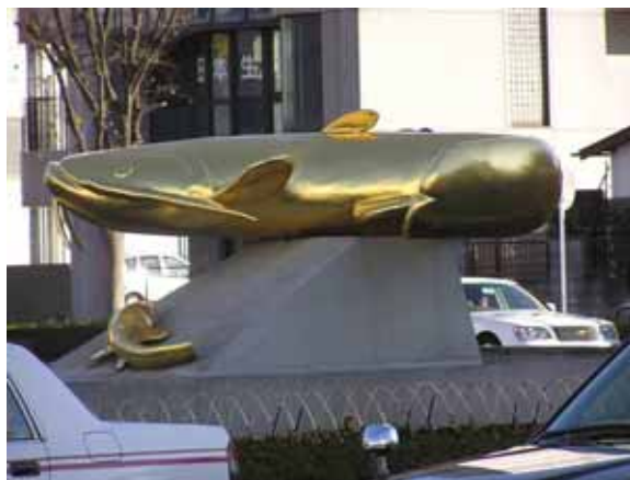
解散の吉川駅前の金色オオナマズ

非常に寒い日でした。だけどいつものように、元気な参加者はがんばってあるきました。