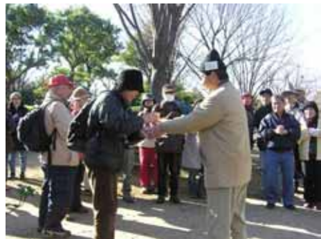
恒例「WALK 歩いたで賞」表彰式