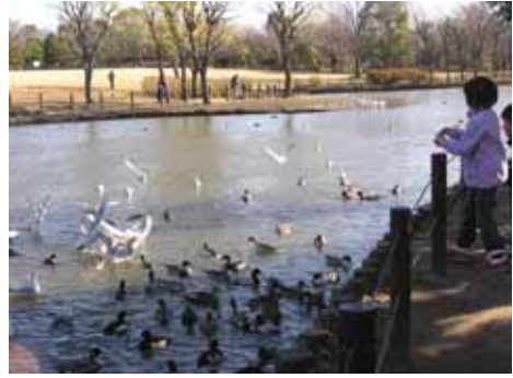
うーん、餌付けかあ...