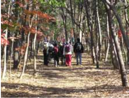
まだ紅葉？ の雑木林