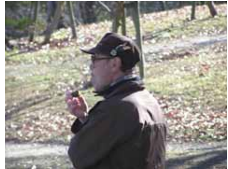
そうか公園でお昼。