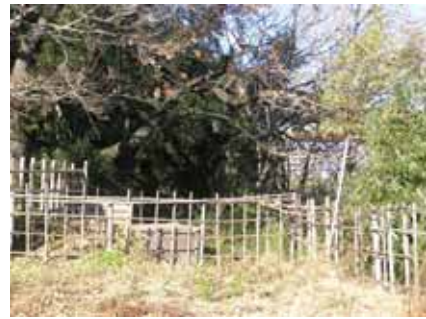
中川のほとり。保護されています。