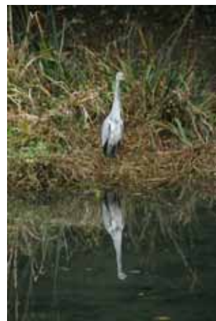
池にたたずむアオサギ。