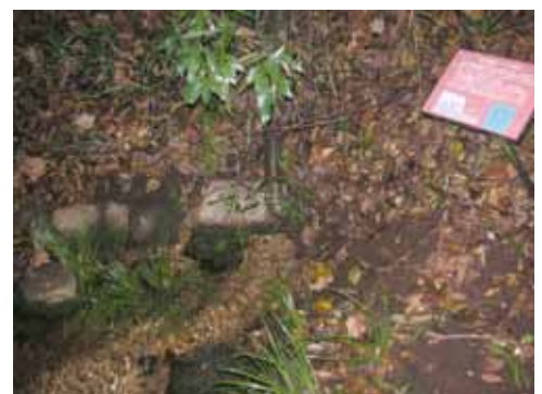
野川の源流のひとつ。これが集まり野川となる。