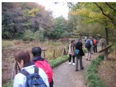
復元された姿見の池。