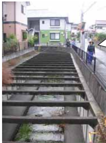
都市河川野川の上流は完全な三面張り。中流域の景観とは全然違いますね。