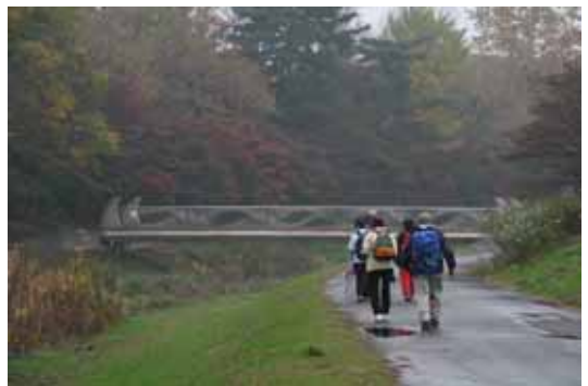
都立武蔵野公園。紅葉の野川沿いを歩きました。

今回のネイチャーウォークは、多摩川の支流である野川沿いを上流へ向かって歩きました。歩くにはとてもいい時期！ 超人気番組「なんでも鑑定団」も当日国分寺に来ていました！・・・なのにあいにくの天気。しかし、「雨ニモマケズ」少数精鋭で臨んでいきました。