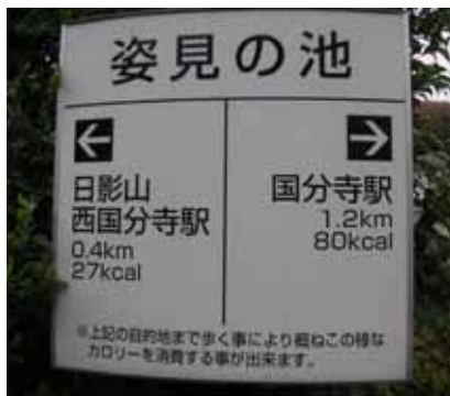
案内板には消費カロリーが表示。今日のネイチャーは何カロリー？