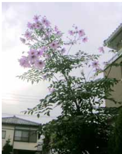
今日の花は「コウテイダリア」に決定。しかし、大きいなあ・・・

源流を見たあとは、ゴールの西国分寺駅に向かってラストウォーク。途中にあった姿見の池ではサギなど野鳥も多く見られました。ここは一度埋め立てられてしまったことがあるようですが、今はもう立派に復元されていました。