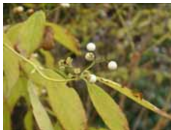
ムラサキじゃないよ、シロシキブだよ。