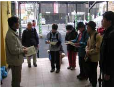
少数精鋭の部隊結成。

野川は国分寺崖線と呼ばれる連なった崖に沿って流れる河川です。崖線からは多くの湧水が湧き出て、その湧水が集まり野川となります。