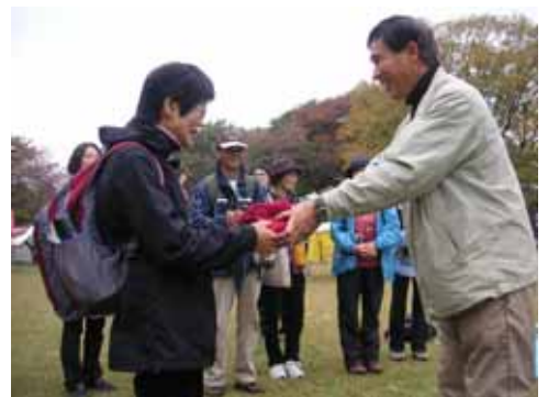
認定書の授与式。おめでとうございます。