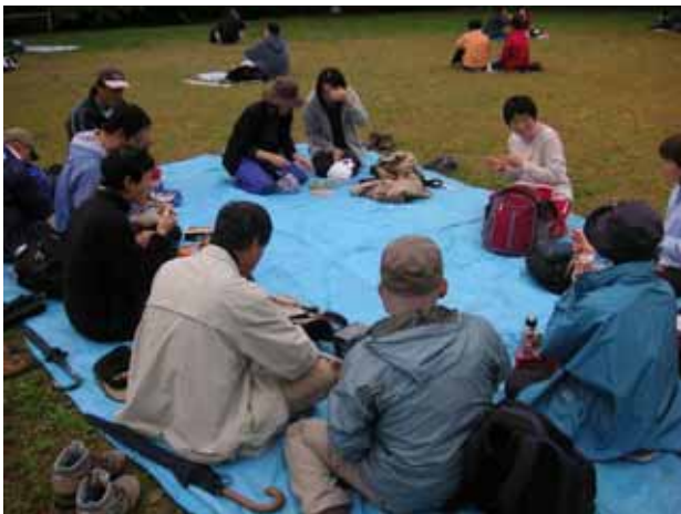
スタッフ持参の巨大ブルーシートに座ってみんなで昼食。

昼食後は認定書の授与式、今月は1人の方が授与されました。人数も少なく、選び抜かれた超豪華な粗品も贈呈。これからもネイチャーウォークをよろしく願いいたします