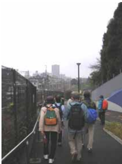
ゴールの西国分寺に向かう一行。西武鉄道が走っていました。