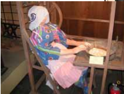
機織り機を実演していただきました、少し動きが硬いようですが・・・

ゴールに向かう前に、養蚕の実習教室ともいえる競進社模範蚕室にも寄りました。蚕を飼育していた籠や機織り機が置かれ当時の様子が想像できました。