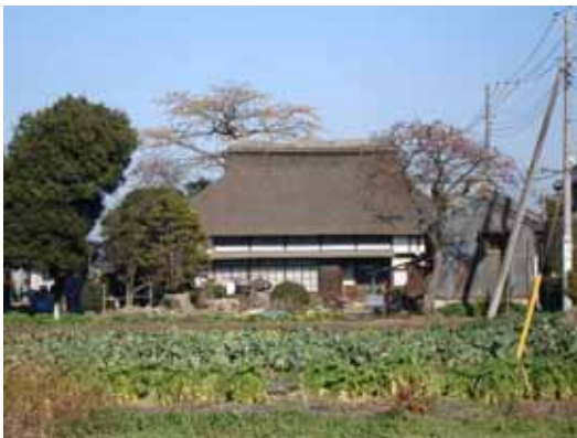
塙保己一旧宅、なんと人が住んでいました。