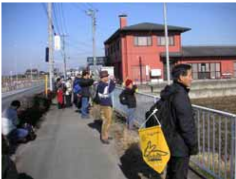
ふと田んぼに目をやると、なにやら動くものが・・・。あ、タゲリだ！！