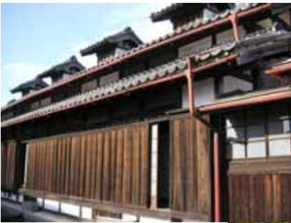
埼玉県の近代化産業遺産である競進社模範蚕室

昼食のあとは、待ち焦がれた認定式。今日は2人の方が認定を受けました。おめでとうございます！これからもネイチャーウォークをよろしくお願いいたします。