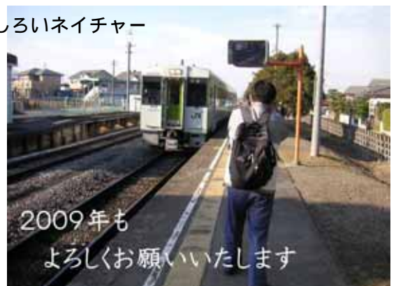
八高線のディーゼルカーの乗り心地は最高です。