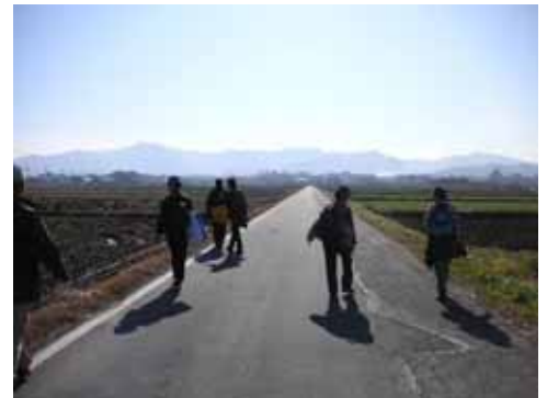
なんだかかっこいいネイチャーウォーカーたち！