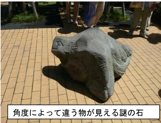
角度によって違う物が見える謎の石

まずは芝浦アイランドを1周。芝浦アイランドの人工の潮だまりでは、たくさんのベンケイガニを見ることができました。食べられるかどうか気にしている人がいましたが、残念ながら基本的に食用ではないとのこと。でも、中華料理ではベンケイガニの卵を使った料理もあるのだとか。