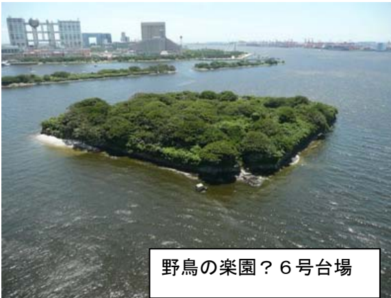
野鳥の楽園？ 6号台場