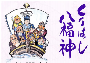
久喜市 HP より

栗橋八福神は、栗橋の主要な 8 つの寺院に、地元の酒井石材店さんが八福神（七福神に「吉祥天」を加えたもの）を寄贈したところからはじまったようです。