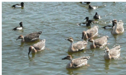
サカツラガン(飼い鳥です)の突進!