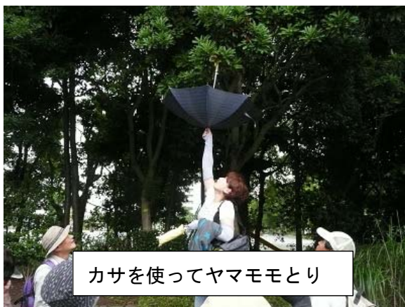
カサを使ってヤマモモとり