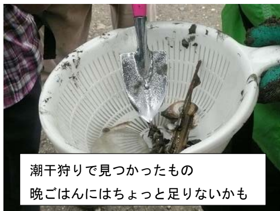
潮干狩りで見つかったもの 晩ごはんにはちょっと足りないかも

砂をひたすら掘って、貝を探します。砂を掘るのは意外に重労働。残念ながら、アサリがあっさり見つかるようなことはありませんでしたが、ハマグリやハゼなどを見つけることができました。