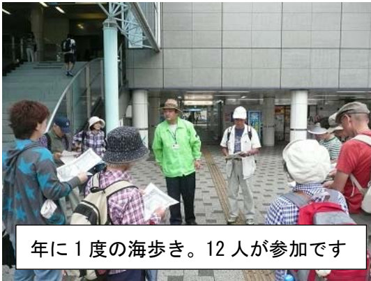
年に 1 度の海歩き。12 人が参加です