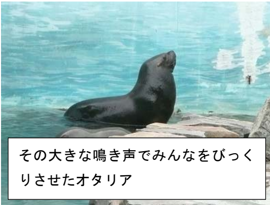
その大きな鳴き声でみんなをびっくりさせたオタリア