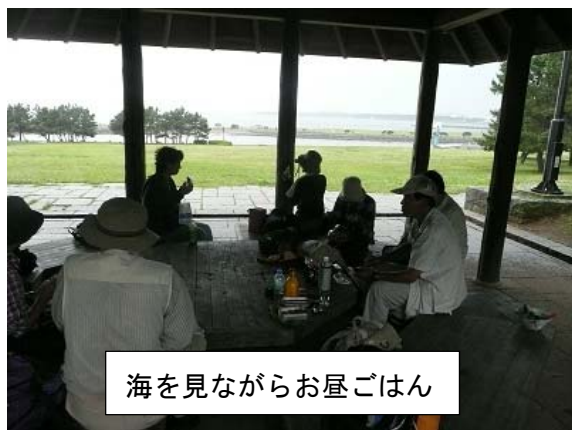
海を見ながらお昼ごはん

お昼ごはんの休憩時にはやや雨が強めに降っていたので、どうなるかと思ったところ、日頃の行いの賜物か、休憩が終わる頃に雨が止み、みんなで満を持して潮干狩りに出かけます。