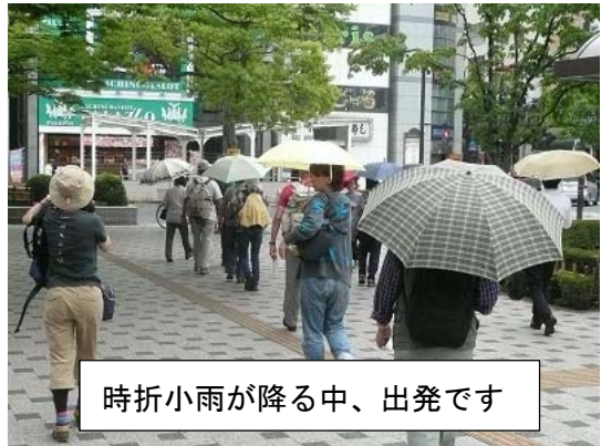
時折小雨が降る中、出発です

ネイチャーウォークでは、年に 1 回の恒例、海歩き。今回は東京に出て、江戸川区自然動物公園と葛西臨海公園を歩きます。