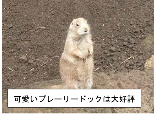
可愛いプレーリードックは大好評