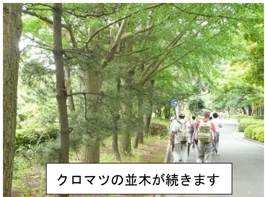
クロマツの並木が続きます

昭和40年代までは防波堤だった健康の道を通り、葛西臨海公園に向かいます。大量に埋立てが行われた結果、健康の道からはまだまだ海が見えません。クロマツの並木がわずかに過去を偲ばせます。