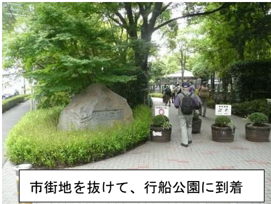
市街地を抜けて、行船公園に到着

当日は、時折小雨の降るあいにくの天気ではありましたが、12 人の参加者が集まりました。さあ、海に向かって出発です。