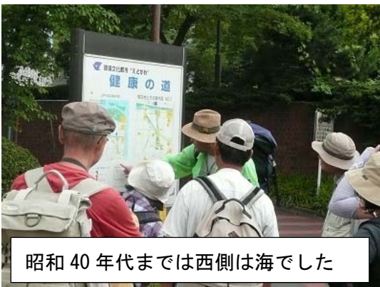
昭和40年代までは西側は海でした

江戸川区自然動物公園は無料の小型動物園で、45種類もの動物がいます。動物とのふれあいができることが有名で、運が良ければ、ペンギンのお散歩に出会える時もあるかも。残念ながら当日はふれあいイベントはありませんでしたが、さまざまな動物を堪能することができました。