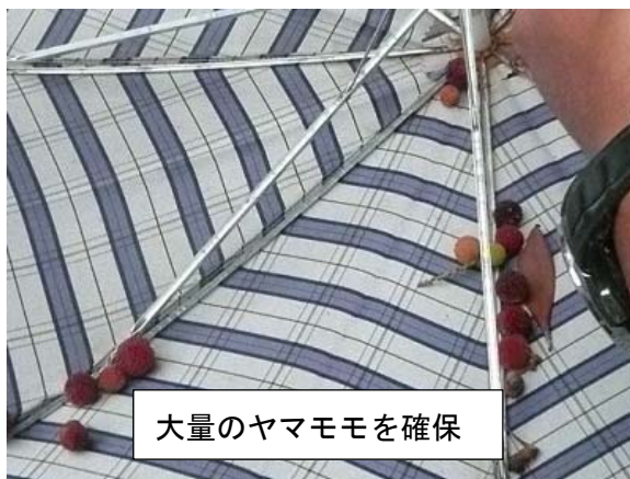
大量のヤマモモを確保

健康の道治いには甘いヤマモモがいっぱい。ヤマモモを堪能している鳥たちに負けじと、カサを使ってヤマモモを取る人も。熟したヤマモモはとても甘くておいしかったです。