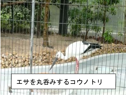
エサを丸呑みするコウノトリ