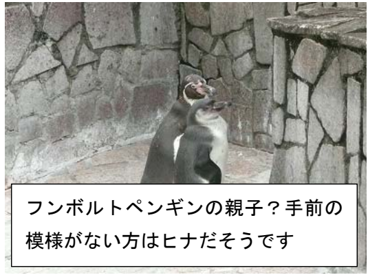
フンボルトペンギンの親子？手前の模様がない方はヒナだそうです

江戸川区自然動物公園は無料の小型動物園で、45種類もの動物がいます。動物とのふれあいができることが有名で、運が良ければ、ペンギンのお散歩に出会える時もあるかも。残念ながら当日はふれあいイベントはありませんでしたが、さまざまな動物を堪能することができました。