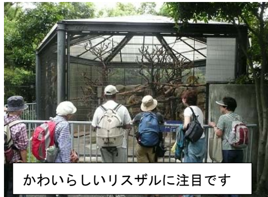
かわいらしいリスザルに注目です