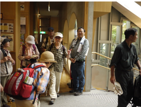
飛鳥山公園内の博物館で解散

飛鳥山公園に着いたところで本格的な雨が降り出し、公園内の博物館で解散となりました。