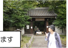
名主の滝公園を出ます

名主の滝公園に到着！ 都会の中に突如広がる自然あふれる公園は、「こんなところがあるなんて知らなかった！」と、驚く参加者の声が聞かれました。