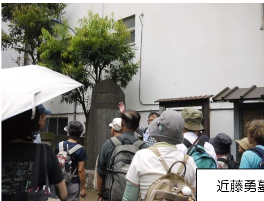
近藤勇墓所に到着