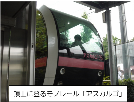
頂上に登るモノレール「アスカルゴ」

いよいよ目的地、飛鳥山公園に到着です。頂上に登るモノレール「アスカルゴ」に乗って25.4mの頂上（東京一低い山！）をめざしました。