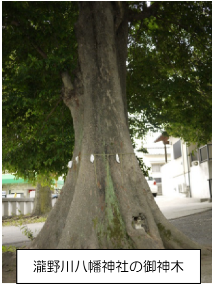
瀧野川八幡神社の御神木

瀧野川八幡神社の中を通り抜けると、立派な御神木・ムクノキや、大きなケヤキに感嘆の声があがっていました。