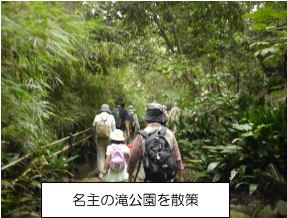
名主の滝公園を散策

名主の滝公園に到着！ 都会の中に突如広がる自然あふれる公園は、「こんなところがあるなんて知らなかった！」と、驚く参加者の声が聞かれました。