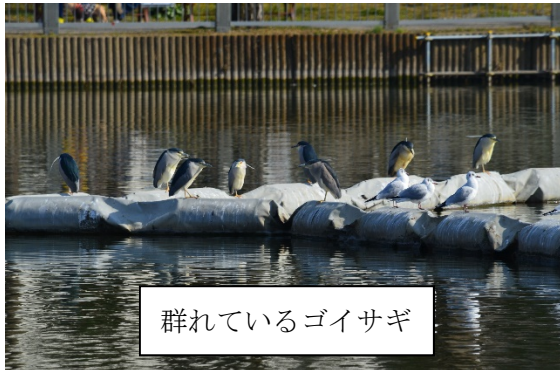
群れているゴイサギ

板橋区に入って昼食をとる浮間公園へ。公園の約40%を占める浮間ヶ池は昭和初期の荒川の大改修で、築堤により残った部分です。この浮間ヶ池にはゴイサギやホシハジロ、キンクロハジロなどのカモたちがたくさん集まってきました。