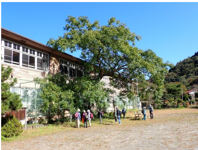
あしがくぼ笑楽校を散策しました！

公園を上がりきったところでお昼を食べた後は麓まで降り、閉校後も活用されているあしがくぼ笑楽校（旧芦ヶ久保小学校）を少し散策しました。味のある校舎でどこか懐かしさを感じることができたのでした。お疲れ様でした！！