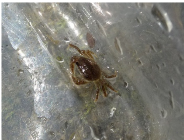
サワガニの赤ちゃん

ガサガサ後、公園横の溪流や公園内の道を散策しました。溪流ではサワガニの子、道ではグミの木でアカスジキンカメムシの幼虫の集団、ヤマカガシの幼蛇等、色々な生きものに出会うことができました。