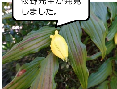
ジョウロウホトトギス