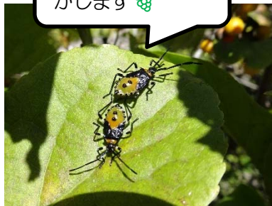
キバラハリカメムシ (幼虫)